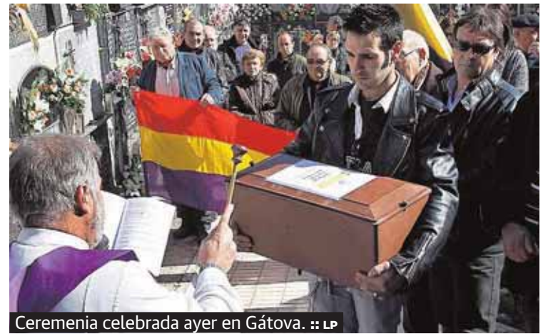
Ceremonia celebrada ayer en Gátova.