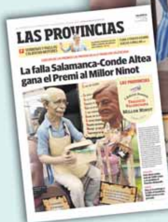
La primera edición del Premio la ganó en 2011 la falla Salamanca-Conde Altea

Pueden consultar las bases completas en lasprovincias.es